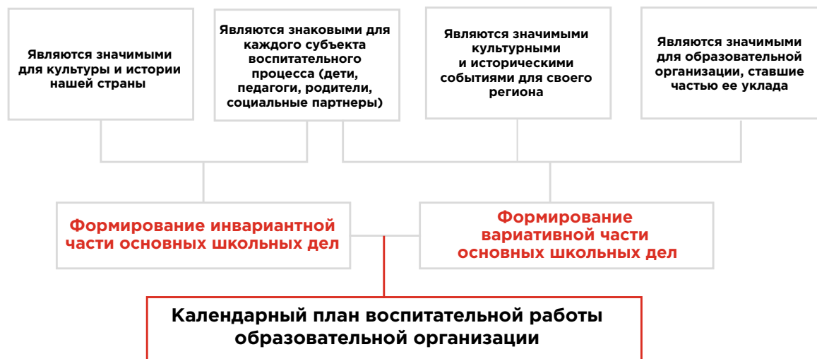
Рисунок 1 – Схема отбора событий для включения в модуль «Основные школьные дела»

Из примерного календаря воспитательной работы, перечня значимых дат региона и уклада образовательной организации выделите события, которые